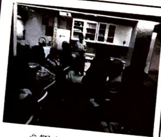
參觀安居資源中心