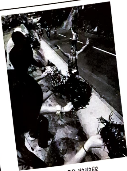
逆走 100 啦啦隊