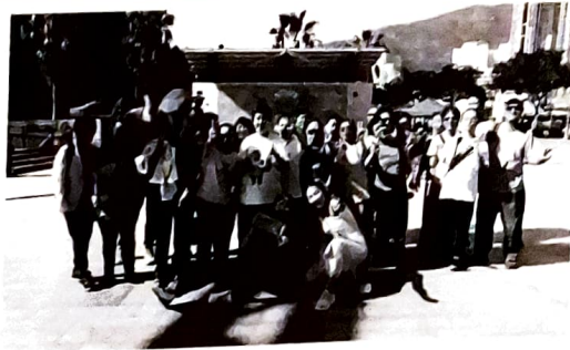
愛跑·香港仔舞蹈表演