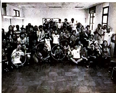
六藝 FUN FUN 日營