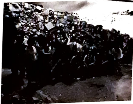
參觀 T Park