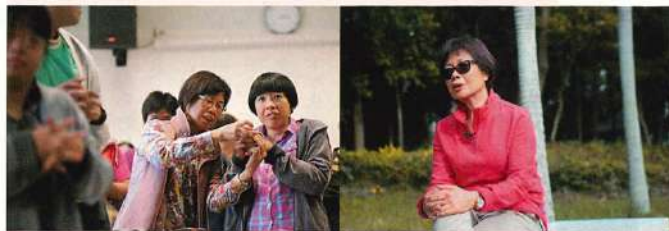
每逢週末，許太都會帶 Winnie 到勵智協進會許太空間的時候喜歡參加社區中心的活動，好學的她很享受參加不同的課程，例如拉筋、手工，甚至簡易的電腦班。